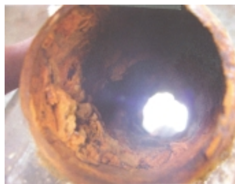
Sinkitty kylmävesiputki ennen Bauer-vedenkäsittelyn asennusta.

SUOMESSA tehdään putkiremontti arviolta 100 000 asuntoon vuodessa ja useimmiten perinteisin menetelmin. Ruotsissa sen sijaan on käytetty DaKKI-menetelmää tuhansissa asunnoissa jo toistakymmentä vuotta. Menetelmä on tuttu muullakin Euroopassa. Meille DaKKI rantautui pari vuotta sitten. Uuden menetelmän ansiosta asunnossa voi koko ajan